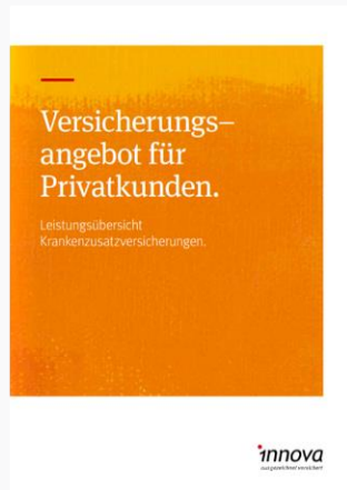
Broschüre Versicherungsangebot für Privatkunden →